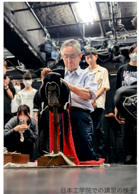
日本工学院での講習の様子